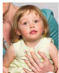
1 person only in photo ✗