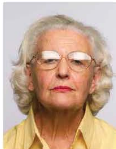
No glare on glasses ✗