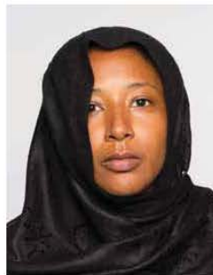
Avoid covering face ✗