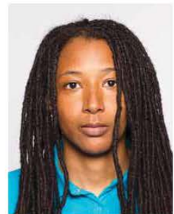
Keep hair off face ✗