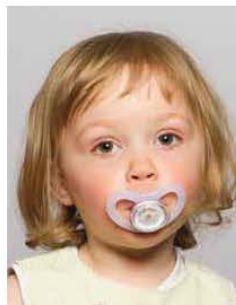
No dummies ✗