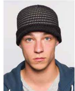
No fashion hair covering ✗