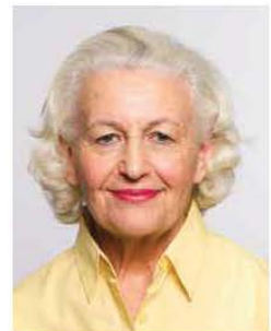
Don't smile ✗