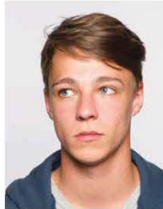
Don't look away from camera ✗